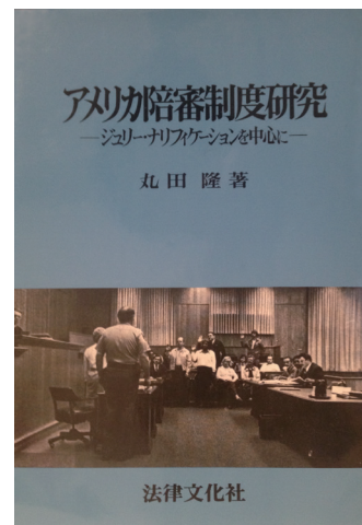
アメリカ陪審制度研究 — ジュリー・ナリフィケーションを中心に — 丸田 隆 著 法律文化社 (1988)

御紹介の『アメリカ陪審制度研究 — ジュリー・ナリフィケーションを中心に —』丸田隆著 法律文化社 1988. 6刊(請求番号327.953 || M)『アメリカ民事陪審制度』丸田隆著 弘文堂 1997. 3刊(請求番号327.953 || M)は、2階閲覧室入口に配架していますので御活用ください。