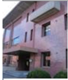
図書館北側 (テニスコート側)