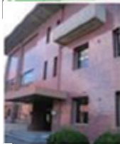
図書館北側 (テニスコート側)

ここで本の貸出返却、資料の調べ方の相談、他大学への閲覧、取寄せの申込等を受付けています。