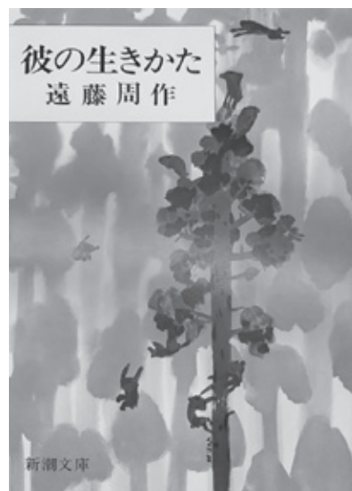
「彼の生きかた」 遠藤周作著 新潮文庫

一冊の本との出会いというと、私にはまず、この一冊になります。と同時に、学生時代のアルバイトや研究室でのことも思い出されます。つらつらと思い出すままに書いてしまい、收拾がついていませんが（就職のところまでは、書くつもりはなかったのですが）、最後に、皆さんにお話しておきたい人のことを書きます。彼は、バイト仲間の一人で、文学部で行動心理学を勉強していたのですが、その過程で霊長類に興味を持ち、理学部に転部しました。彼とはいろいろと話をしていたので、「彼の生きかた」という本があるよと伝えました。彼はさっそく読んだらしく、「俺よりさきにこの本のことを知っていたのが悔しい」というようなことを言っていました。かなり後から、分かったのですが、彼は霊長類を専門とする研究室に進み、理学博士を取得されたとのことでした。彼こそが「彼の生きかた」にふさわしい人間なのだという事をお伝えして終わりたいと思います。乱筆、乱文失礼いたしました。